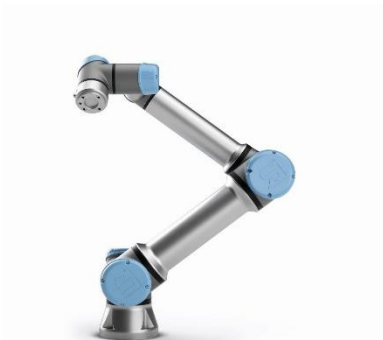
Bild 3 CoBot Roboter von Universal Robots.